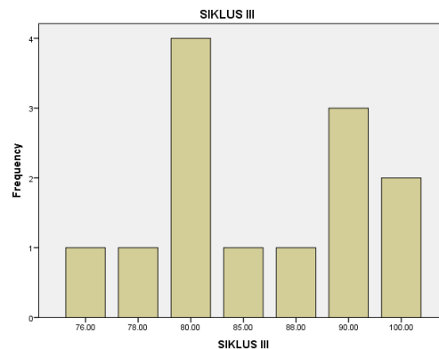
Gambar 3. Diagram Batang Hasil Evaluasi Siklus III

Berdasarkan nilai rata-rata dan sebaran data hasil evaluasi pada siklus ketiga menunjukkan bahwa sebanyak 6 siswa atau 46,15% yang memperoleh nilai di bawah rata-rata dan sebanyak 7 siswa atau 53,85% yang memperoleh nilai pada rata-rata dan atas di atas rata-rata. Hasil ini menunjukkan bahwa perolehan hasil belajar Pendidikan Agama Kristen pada siklus III sudah cukup baik, yang ditandai dengan lebih dari 50% siswa yang memperoleh nilai pada rata-rata dan di atas rata-rata. Apabila melihat dari masing-masing siswa, menunjukkan kenaikan perolehan nilai yang berkisar antara 1 – 10 poin. Dari ketiga siklus yang telah diberikan dalam pembelajaran menunjukkan peningkatan kenaikan hasil belajar. Ketika guru memperbaiki baik materi yang ditambahkan dengan gambar yang berwarna dalam kehidupan sehari-hari sesuai dengan materi dan disertai pemberian contoh melalui video yang diambil dari YouTube mampu meningkatkan hasil belajar siswa dalam mata pelajaran Pendidikan Agama Kristen.